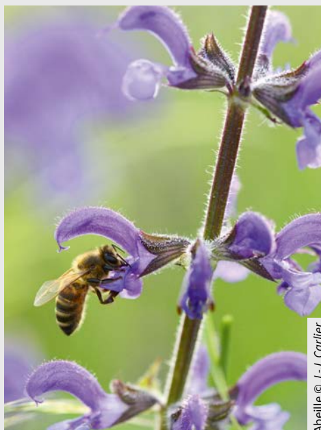
Abelle © J.-J. Carlier